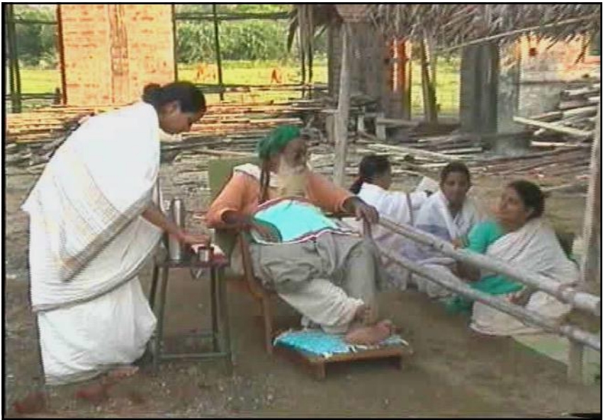
Yogiji, Ma Devaki et les soeurs de Sudama