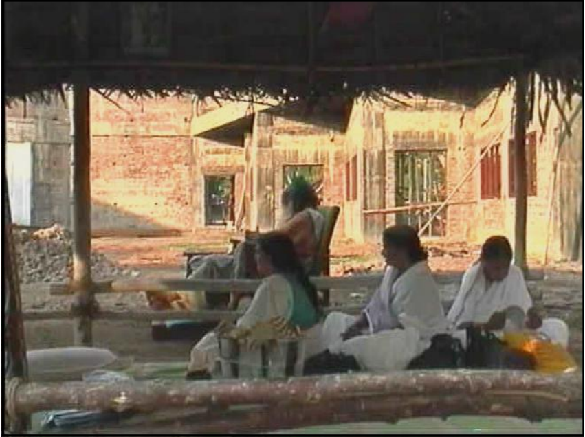
Yogiji dirigeant et bénissant les travaux