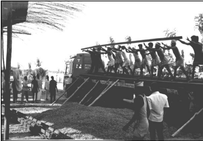
Déchargement des poutrelles métalliques qui seront soudées pour former l'armature du toit du mandir principal qui pourra accueillir 4.000 personnes, sans aucun pilier à l'intérieur