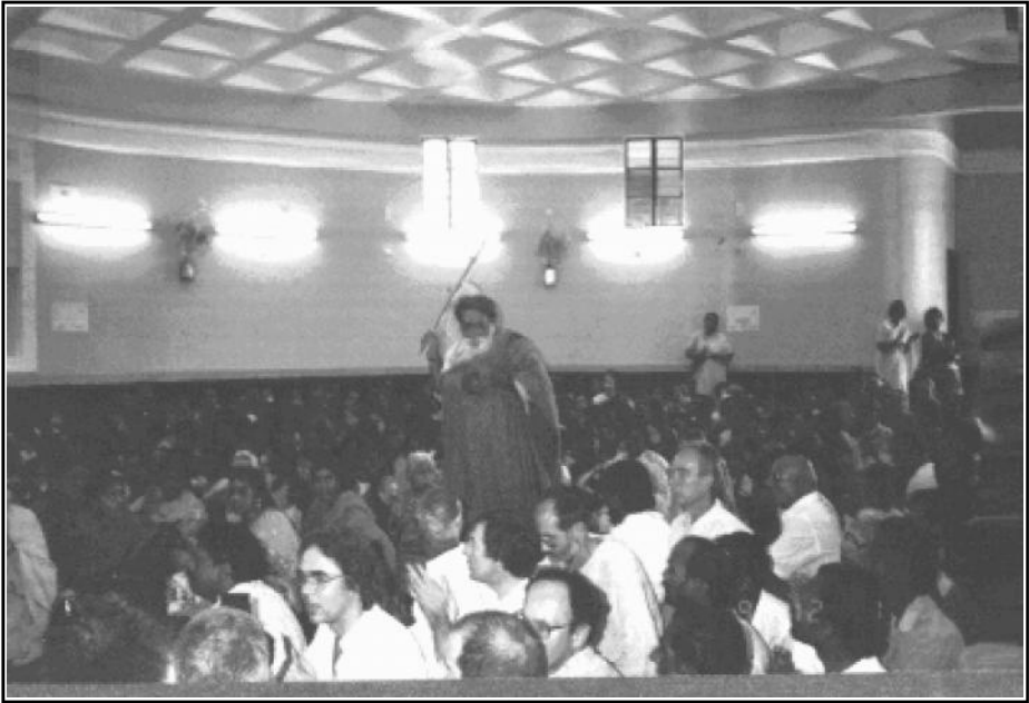
Bhagavan SriYogi Ramsuratkumar lors de son Jayanti à Tiruvannamalai